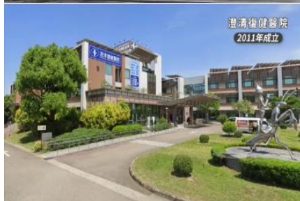
澄清復健醫院 2011年成立